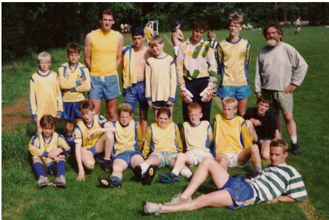
Junioren C4 van 1991 op zomerkamp in Zeist