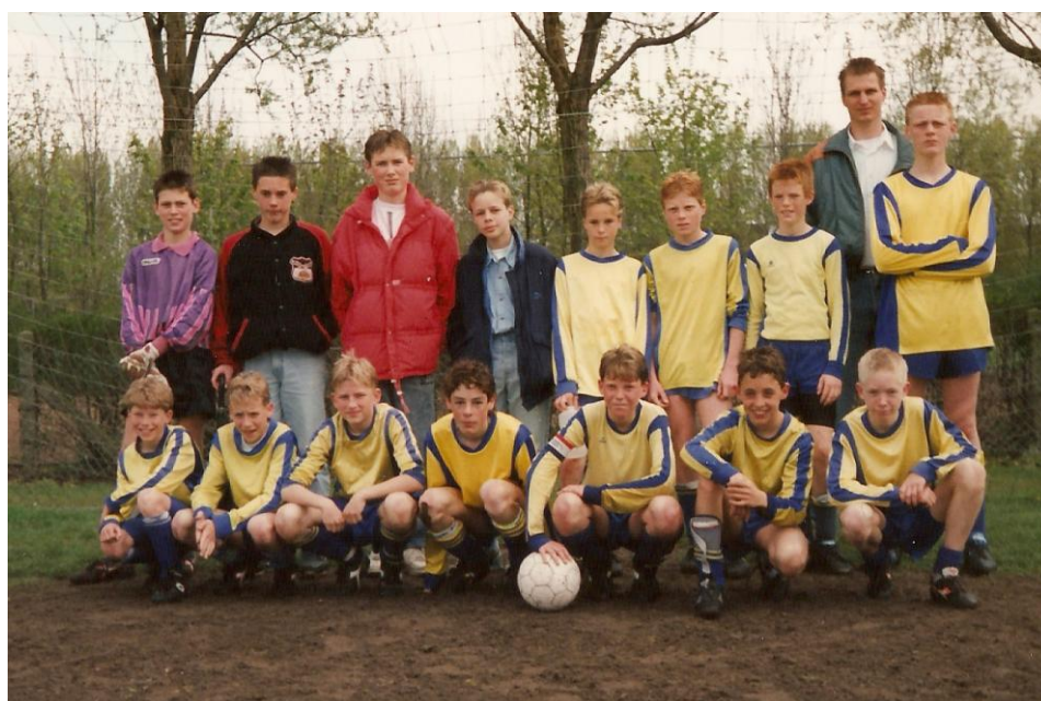
AFC'34 C2 van het seizoen 1990-1991

Het eerste elftal heeft een redelijk seizoen in de 1 e klasse. Het eindigt op de 4 e plaats.