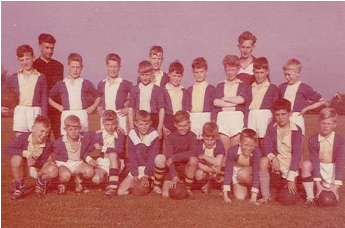
Een groep welpen in 1960. De foto is genomen na een van de trainingen op de "hockeyvelden" vlak na de verhuizing naar de Robonsbosweg.

Hoewel het bestuur menigmaal verklaart dat het nieuwe complex "af" is, en dat zij zich niet mooier kan indenken, wordt er toch ook nog "verklapt", dat men nog bezig is met "terreinverlichting, waardoor conditie-training ook buiten kan gehouden worden. Een tribune ontbreekt nu nog. Die komt echter ook in orde. De tekening hiervan is reeds ter goedkeuring in circulatie. Het wordt een tribune met betonnen onderbouw en stalen kapconstructie. Dus dit komt ook dik in orde."