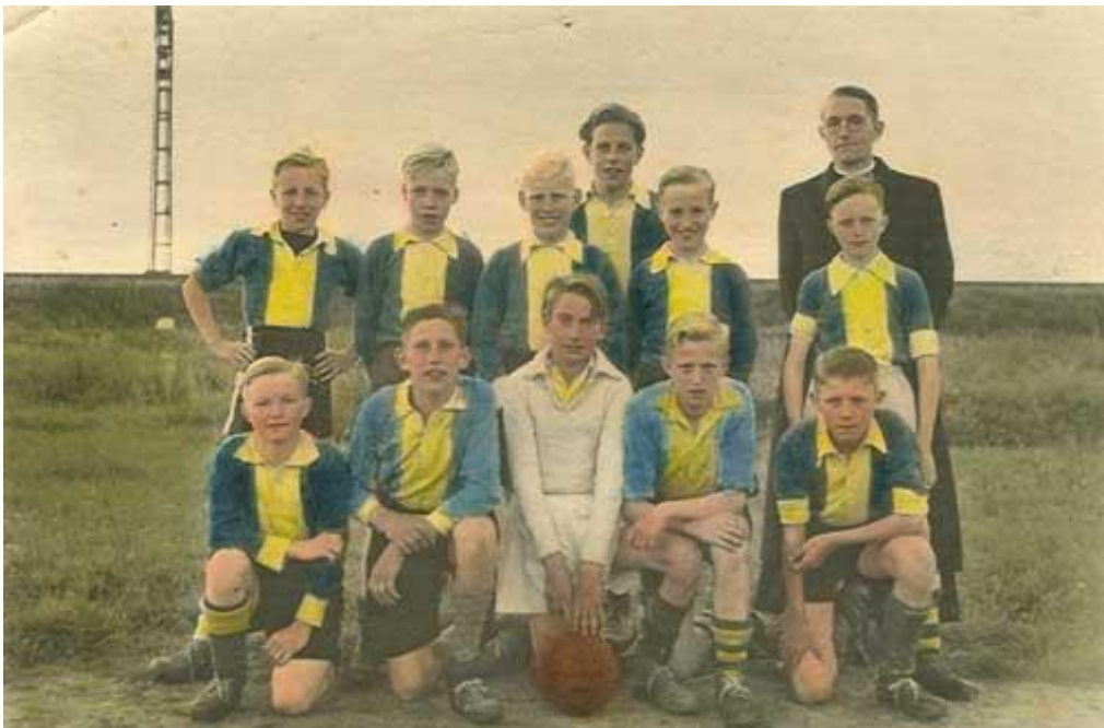
Adspiranten A in 1949